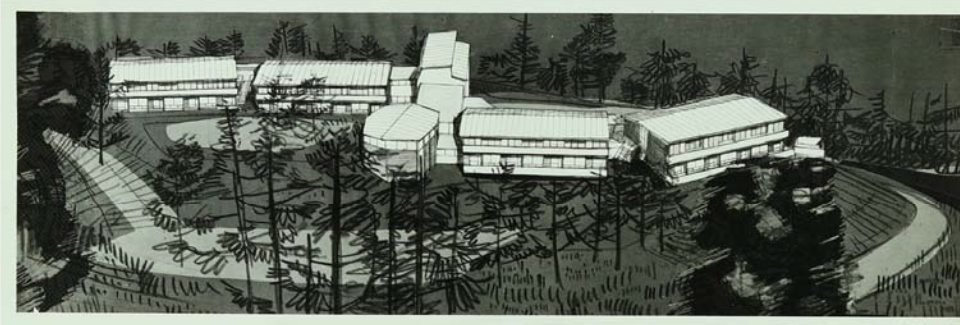
Disegno del progetto di Eugenio Gentili e Annamaria Bozzola