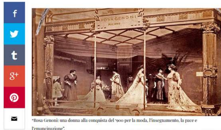
"Rosa Genoni: una donna alla conquista del '900 per la moda, l'insegnamento, la pace e l'emancipazione".