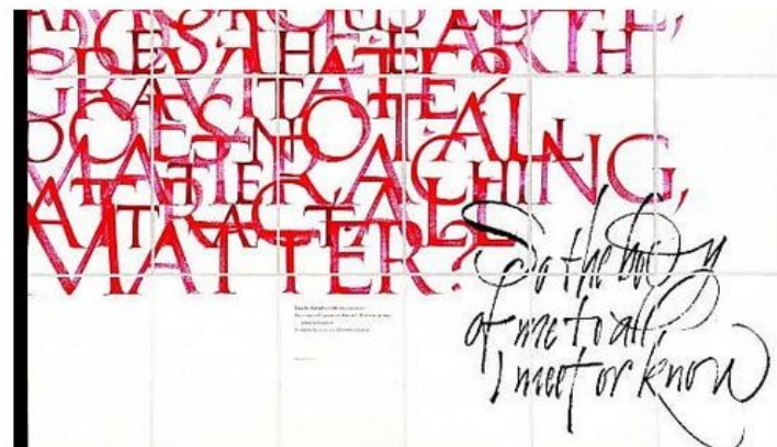
(Associazione calligrafica italiana)

Se pensate che computer, sms ed emoticon abbiano soppiantato tutti quei corsivi di una volta, vi state sbagliando. Le prove? A un convegno internazionale, nei tablet e in cartoleria